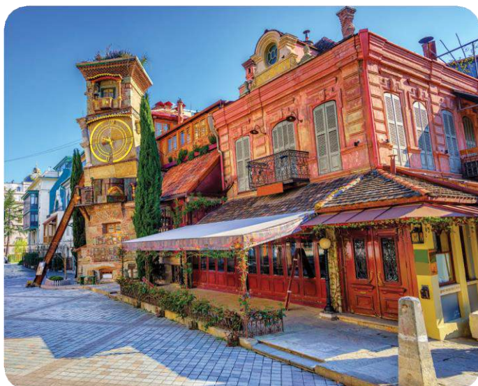
雷佐·加布里亚泽剧院